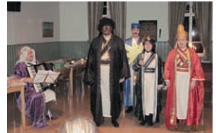
25 Saimaan osaston pikkujoulut Kyyrössä 2009