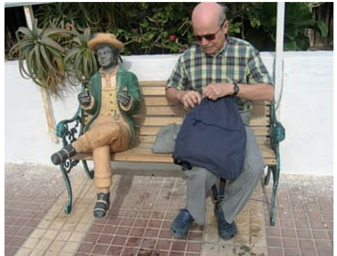
► Kaksi vähäpuheista Kanarialla joulukuussa.