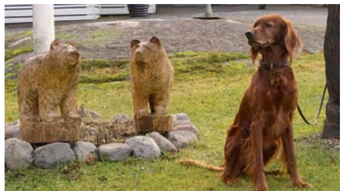
► Ringo ja Kyyrönkaidan pikkukarhut.