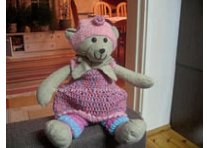
► Nappi Nalle.