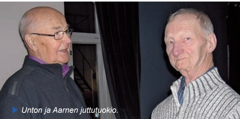
Unton ja Aarnen juttutuokio.