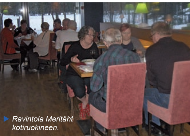
► Ravintola Meritähkötiruokineen.