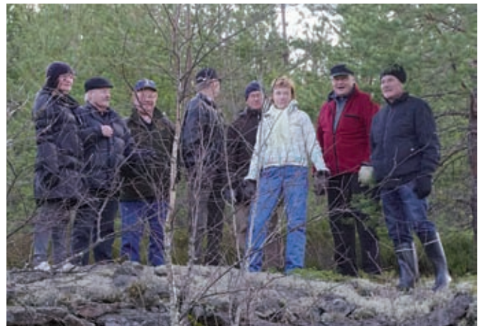
► Kurssilaisia patikoimassa kallioilla.