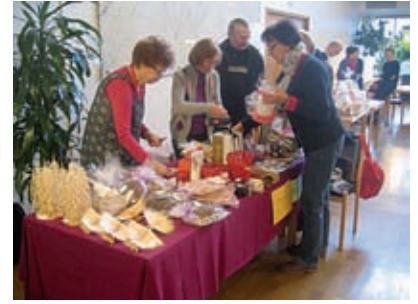
► Myyjäiset Seinäjoen seurakuntatalolla 26.11.2011.