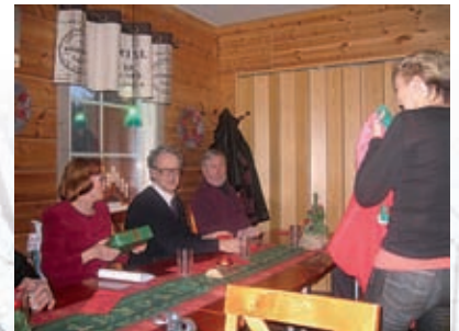
► Pikkujoulunviettoa Joupiskan rinneravintolassa.