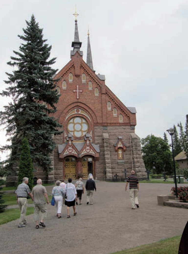
► Seuraava kohde oli Euran kirkko.