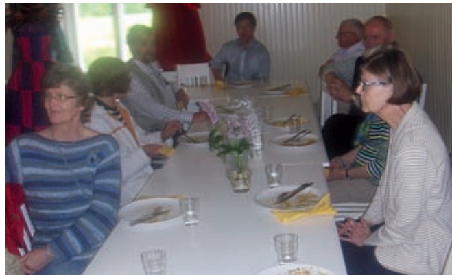
► Kuvassa retkeläisiä Hovilan kartanon Tuomiopöydässä lounaalla.