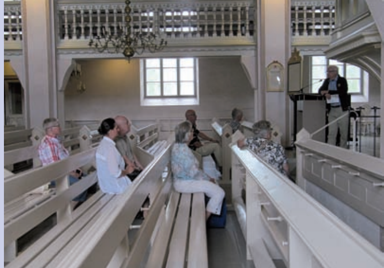
► Seurakunta kuuntelemassa kirkon historiaa.