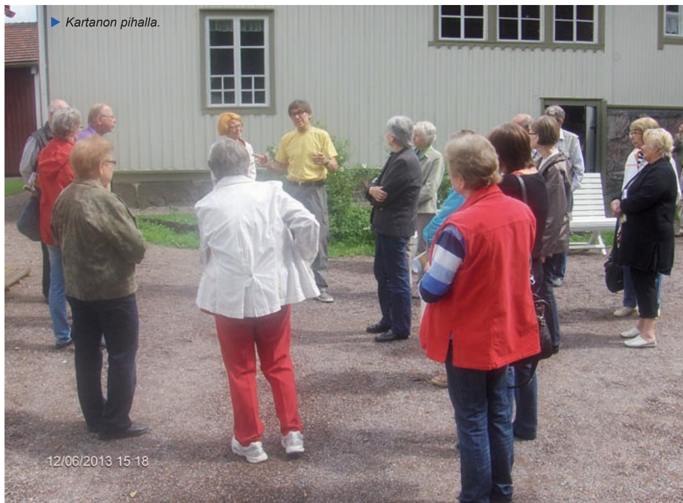
► Kartanon pihalla.