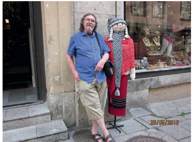
► Tämä "Itämeren Impi" oli hiukan vähäpuheinen.....

Päijät-Hämeen osasto teki kesäretken Tallinnaan, vietimme siellä meno- ja paluu- päivän lisäksi yhden kokonaisen päivän. Retki oli kaikin puolin onnistunut.