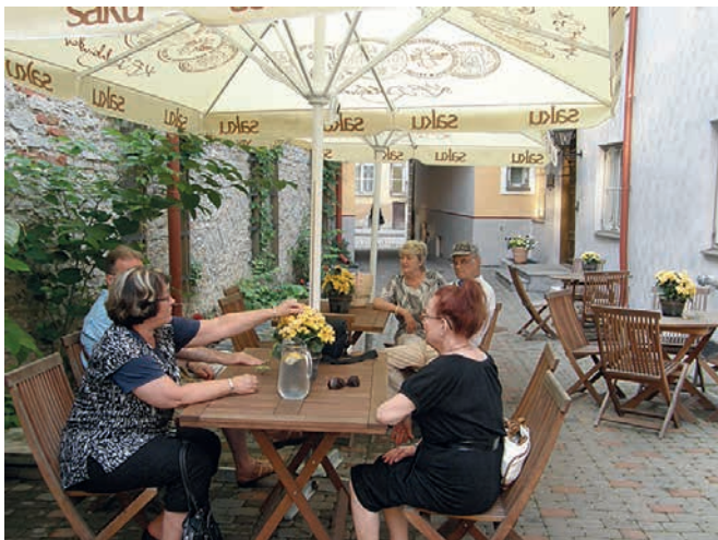
► Viihtyisä oli myös hotellin sisäpiha.