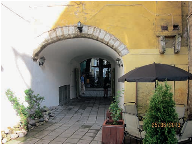
► Tämä sisäänkäynti sai houkuteltua meidät syömään.