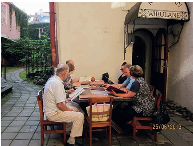
► Ja sitten alkoikin pohtiminen, "Mitä tänään syötäisiin?"