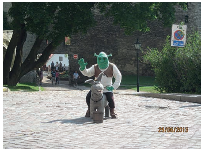
► Toompealle oli eksynyt lasten (ja miksei vanhempienkin) suosikki Shrek aaseineen.