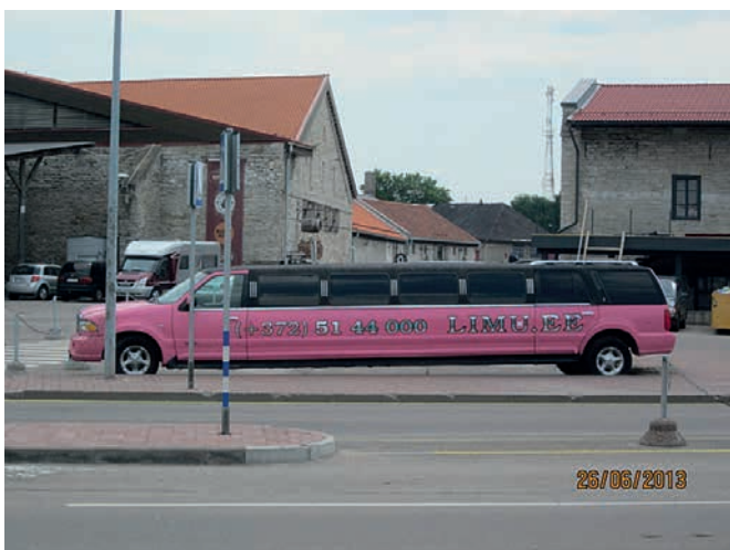
► Tämän kun olisimme bonganneet ajoissa, niin olisimme varmaan ottaneet kyydin!