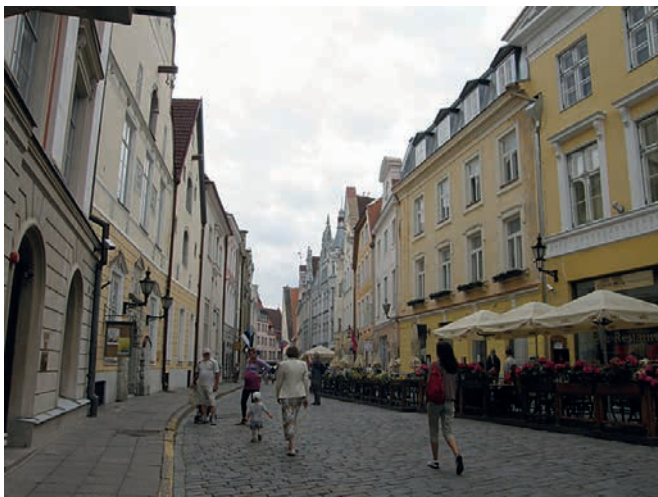
► Hotellimme sijaitsi idyllisellä kadulla aivan vanhan kaupungin sydämessä.