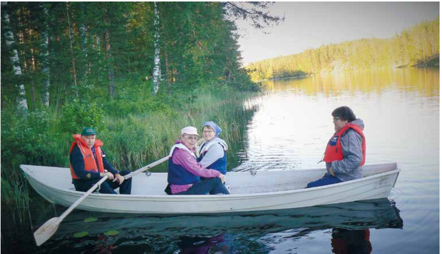
> Rantailta, veneretki

naisuutena. Lisäksi ulkoiltiin, jumpattiin ja rentouduttiin.