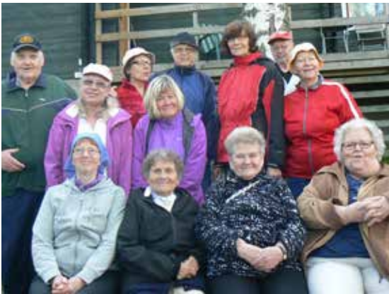
> Rantailta, kurssilaisia