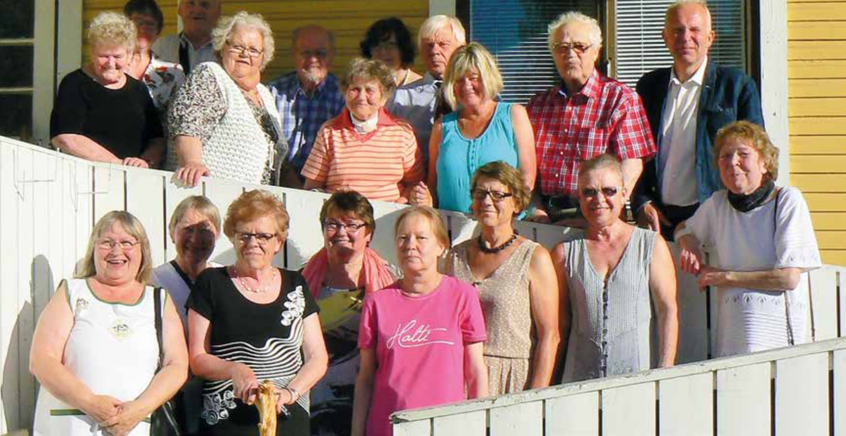
> Suunalueen kurssin osallistujat