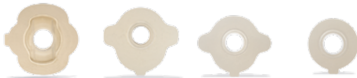
StabiliBase OptiDerm UUTUUS!

OptiDerm-liimapohja on tarkoitettu herkälle iholle, joko jatkuvaan käyttöön tai vähentämään tilapäistä ihoärtymystä (esim. leikkauksen jälkeen). Liimapohja pehmenee kosteassa ympäristössä, on ihoystävällinen ja kestävä.