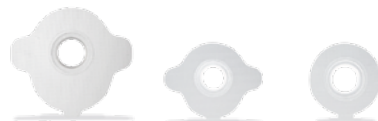
Regular Plus UUTUUS!

Regular-liimapohjat on tehty läpinäkyvästä materiaalista ja ovat joustamattomia FlexiDerm-liimapohjaan verrattuina. Ne sopivat erityisesti ongelmattomalle stoma-aukolle ja iholle.