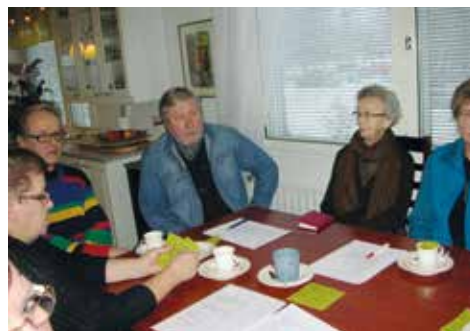
> Osaston vuosikokous 2014