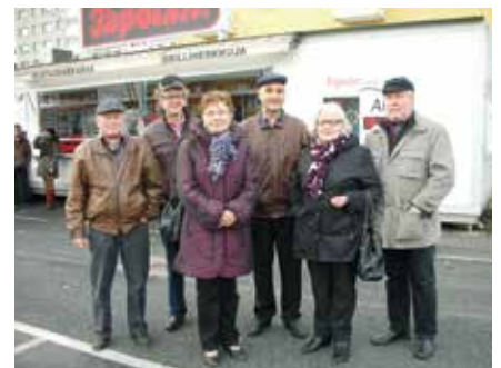
> Tampereen retkelle osallistujia