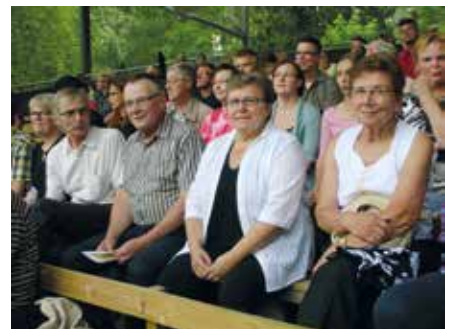
> Kesäteatterissa kävijöitä