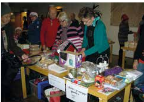
> Seurakunnan adventtimyyjäisissä