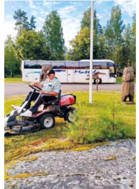
Unton kuva, kyllä lähtee!

Rinnemökeissä oli marjanpoimijoita jotka vielä iltamyöhällä putsasivat päivän satoa.