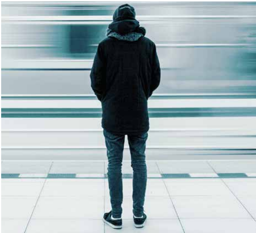
Korona ruokkii erakoitumista s.16

Koronan aikana osa työtä tekevästä ihmisistä ovat etääntyneet ja sosiaaliset kontaktit ovat jääneet vähäisiksi. Etätöiden tekeminen on kasvussa ja monissa yrityksissä suurin osan työntekijöistä työskentelee kotona.