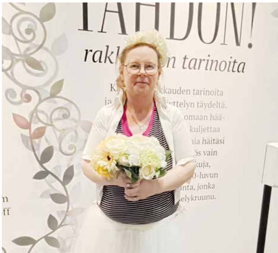
Maijan kertomus s.10

Sairastuminen oli järkytys – massiivinen kajoaminen koko krooppaan – ensin oli oireena jäätävä väsymys, mikä vain paheni. Seuraavaksi huomasi, että kielen oikea puoli oli muuttunut kivikovaksi ja siihen oli tullut piparkakkureunat.